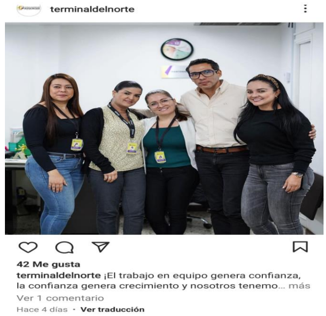
42 Me gusta terminaldelnorte ¡El trabajo en equipo genera confianza, la confianza genera crecimiento y nosotros tenemo... más Ver 1 comentario Hace 4 días · Ver traducción