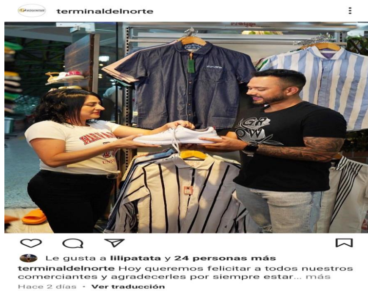
Le gusta a lilipatata y 24 personas más terminaldelnorte Hoy queremos felicitar a todos nuestros comerciantes y agradecerles por siempre estar... más Hace 2 días · Ver traducción