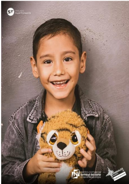
terminalesmedellin y terminaldelnorte Terminal De Transportes Del Norte - Medellín