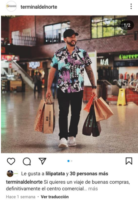
Le gusta a lilipatata y 30 personas más terminaldelnorte Si quieres un viaje de buenas compras, definitivamente el centro comercial... más Hace 1 semana · Ver traducción